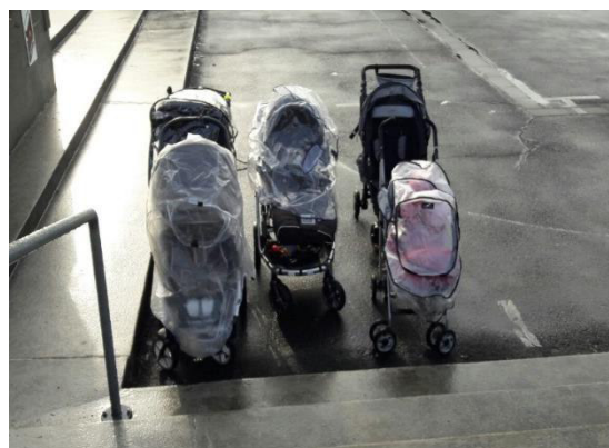
Wagenpark vor der Bibliothek 😊