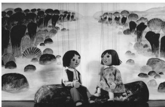
Die Kinderbrücke (Looslis Puppentheater)