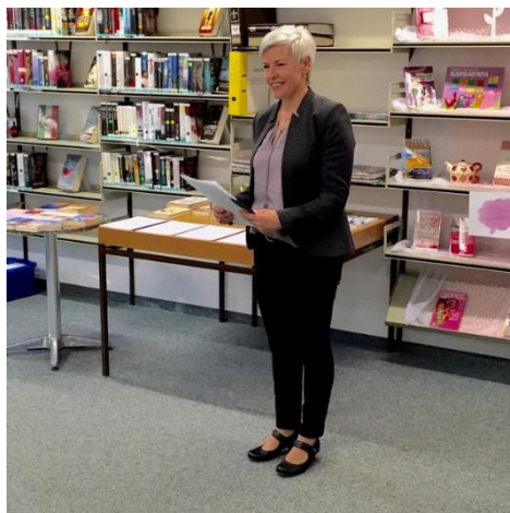
Vortrag „Systemische Aufstellungsarbeit“